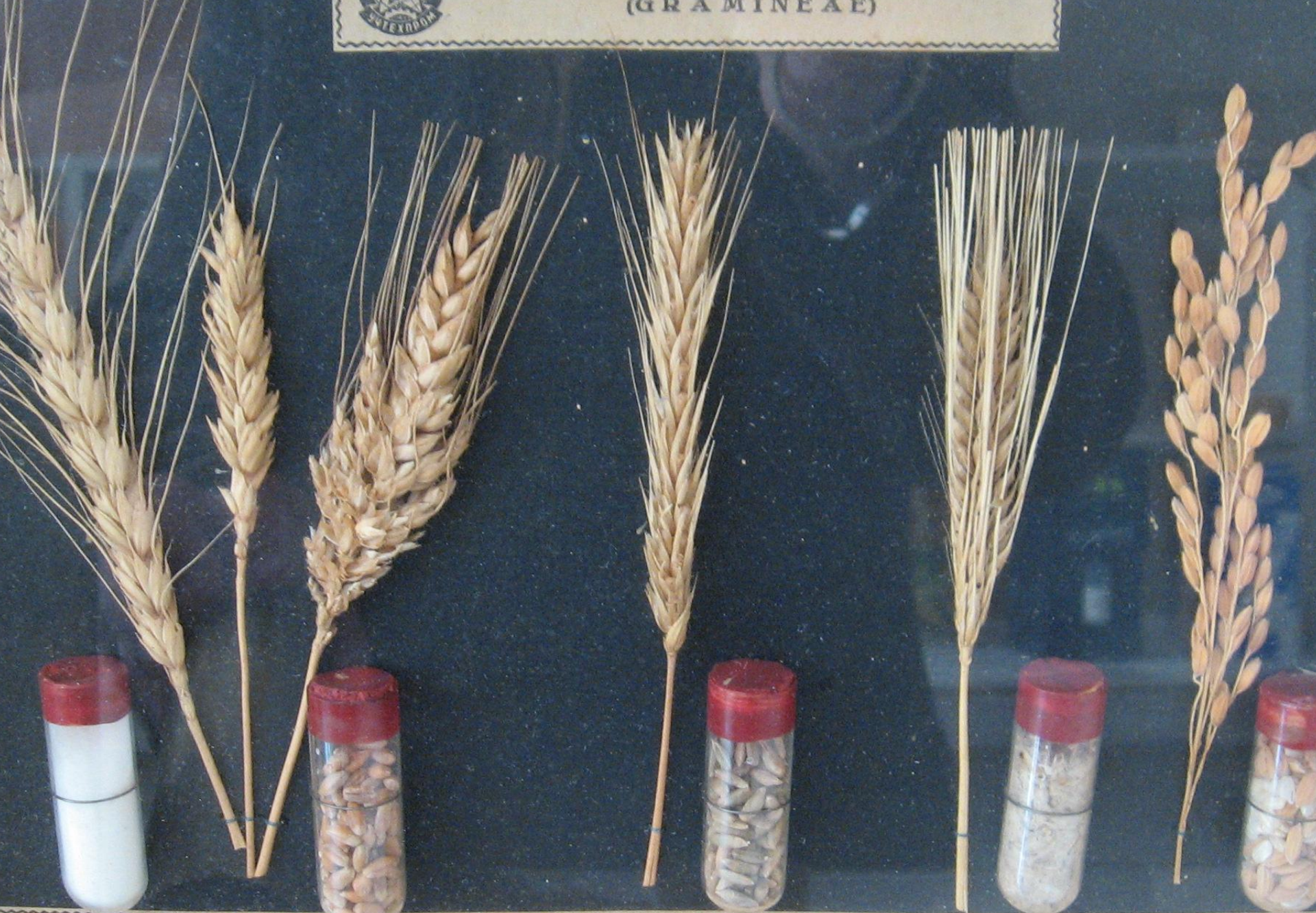
ПШЕНИЦА — TRITICUM Биккловена-11-Tr. vulgare, var. erythrosperrum Созислеста — Tr. vulgare, var. lutescens Донеста — Tr. turgidum